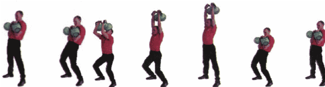
Рис. 6. Толчок двух гирь

При нарушении условий выполнения упражнения повторение не засчитывается, подается команда "НЕ СЧИТАТЬ".