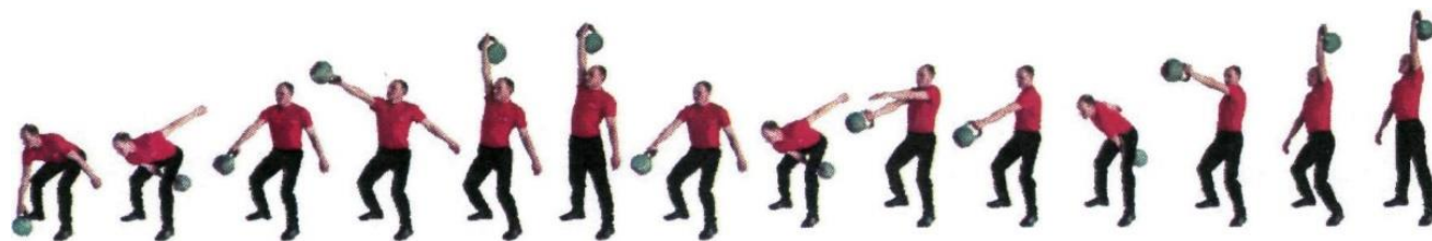
Рис. 5. Рывок гири

При нарушении условий выполнения упражнения повторение не засчитывается, подается команда "НЕ СЧИТАТЬ".