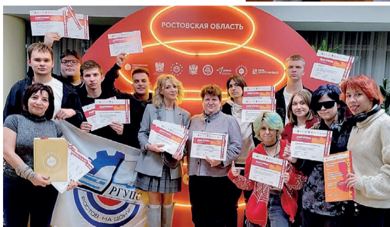
Второе место в общем зачете среди вузов РО получил РГУПС на Областном этапе всероссийского фестиваля-конкурса «Студенческая весна 2026», вместе со множеством призовых дипломов во всех направлениях творчества.