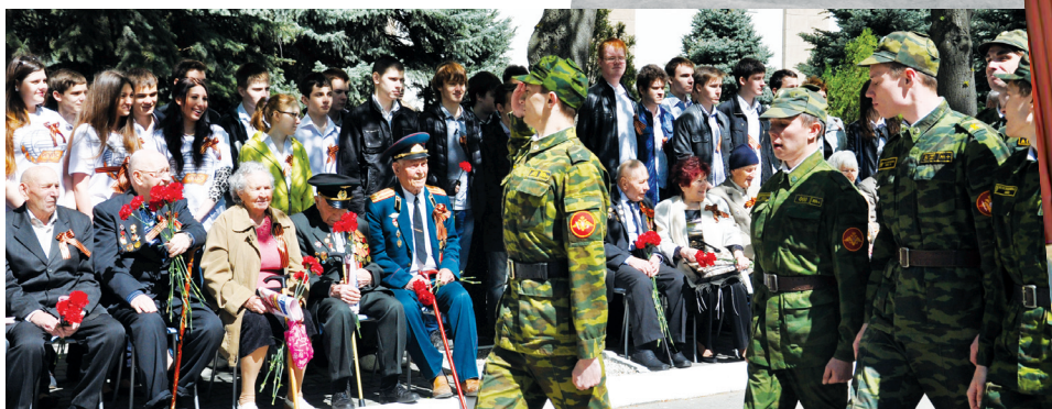
Традиционная встреча ветеранов и студентов университета в преддверии праздника Победы