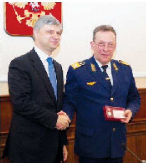
Президент ОАО «РЖД» Олег Белозеров и ректор РГУПС Владимир Верескун

На встрече ректоров вузов ж.-д. транспорта с президентом ОАО «РЖД» Олегом Белозеровым обсуждались актуальные вопросы и перспективы развития отраслевого образования. Олег Белозеров отметил, что для ОАО «РЖД» профессиональная подготовка кадров имеет ключевое значение: «Все задачи, которые перед нами стоят, решают абсолютно конкретные люди. Можно ставить задачи, но они будут абсолютно недостижимы, если мы не подготовим профессионалов, которые будут понимать, как выполнять принятые решения», - сказал президент ОАО «РЖД».