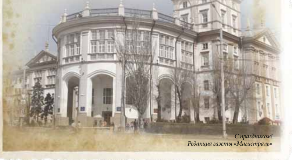
С праздником! Редакция газеты «Магистраль»

В этот знаменательный для нашего издания год желаем всем вам, наши дорогие читатели, яркой, интересной, творческой деятельности, которая непременно приведет вас в нашу редакцию, и вы станете героями наших новых публикаций, которыми будете гордиться вы, ваши близкие и друзья, ну и, конечно, мы! Ведь это наша работа!