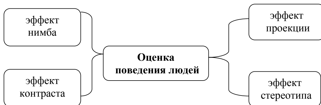
Рис. 3.2. Основные типы оценки поведения людей

Поведение человека определяется или внутренними (свойства человека), или внешними причинами. Воспринимая поведение других, люди часто используют упрощения, представленные на рис. 3.2 [28].