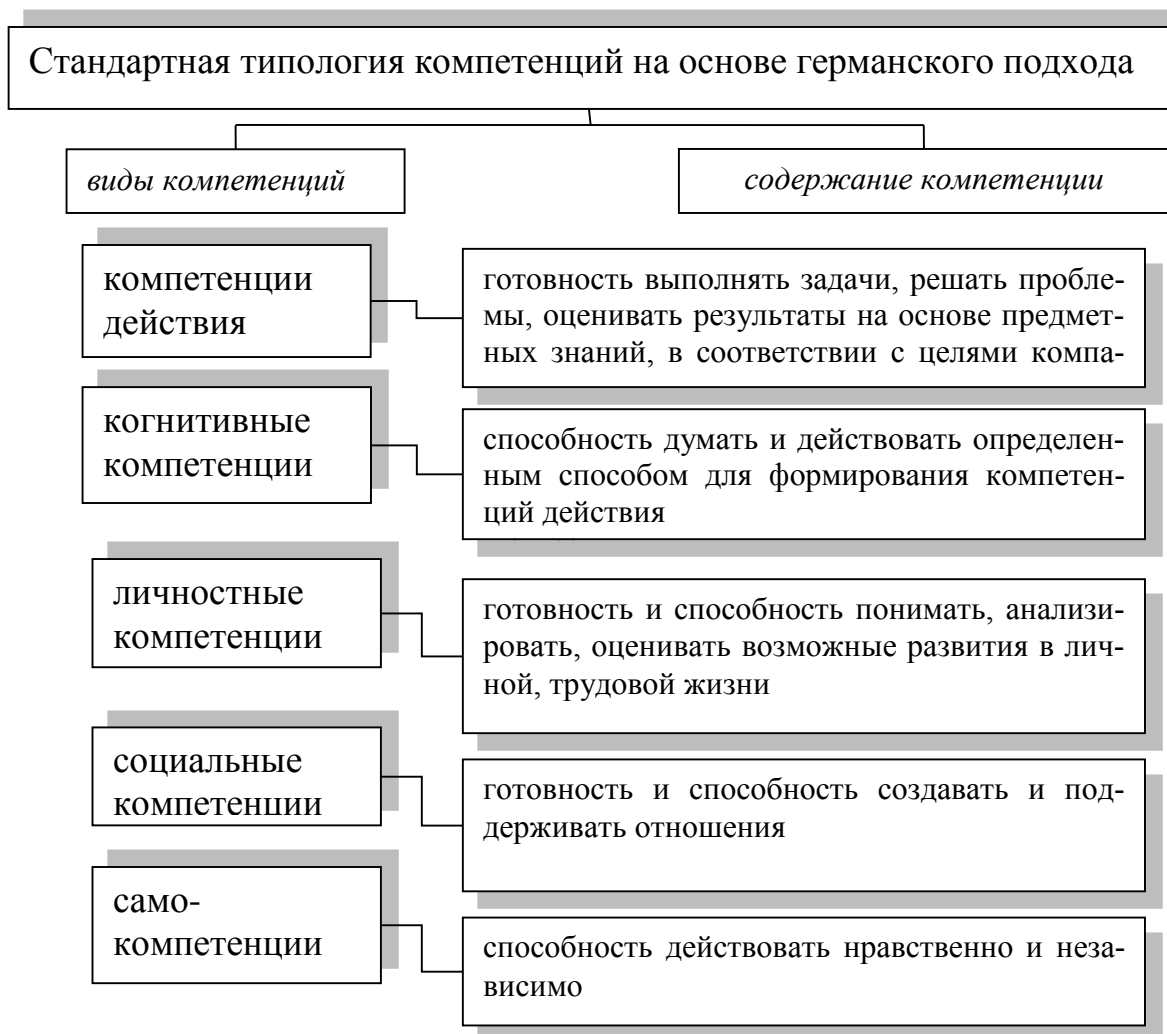
Рис. 4.2. Стандартная типология компетенций на основе германского подхода