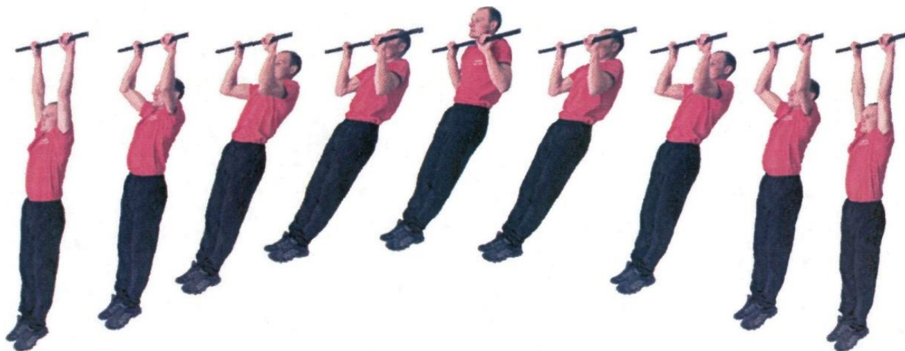
Рис. 2. Подтягивание на перекладине

При нарушении условий выполнения упражнения, повторение не засчитывается, подается команда "НЕ СЧИТАТЬ".