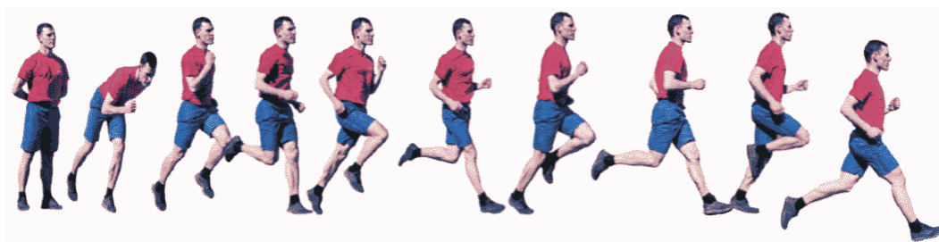
Рис. 13. Бег на 1 км, бег на 3 км.