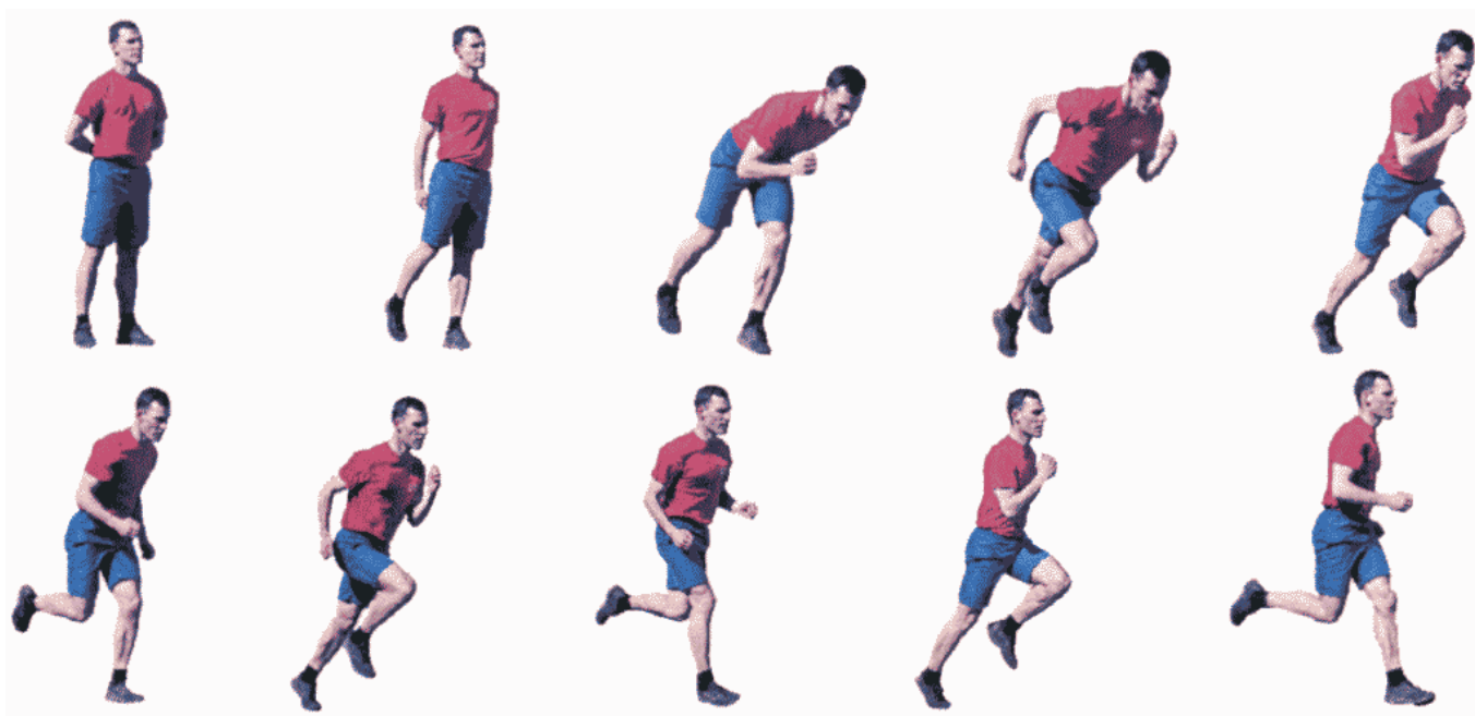
Рис. 8. Бег на 60 м, бег на 100 м