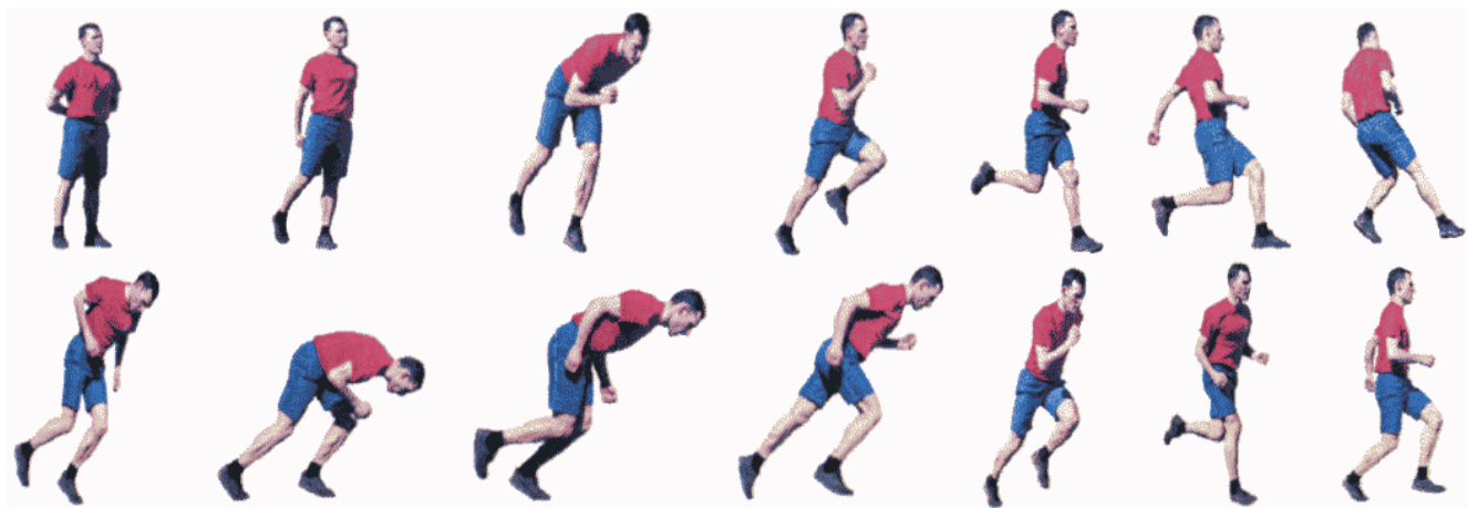
Рис. 9. Челночный бег 10 x 10 м

При нарушении условий выполнения упражнения предоставляется вторая попытка, при повторном нарушении норматив считается невыполненным.