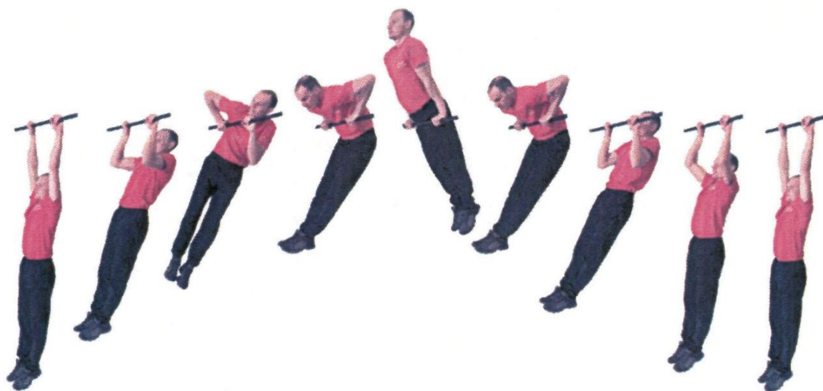
Рис. 4. Подъем силой на перекладине