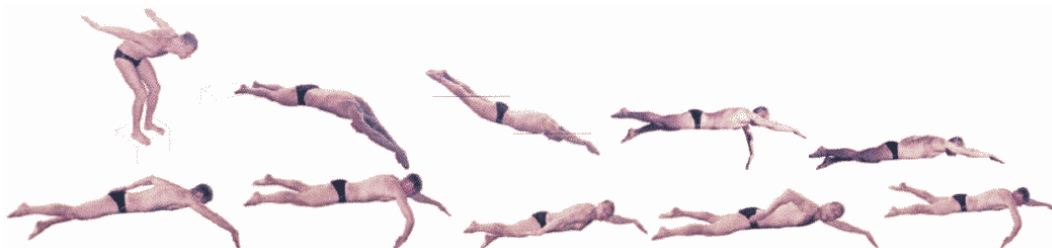
Рис. 10. Плавание в спортивной форме одежды вольным стилем

Старт раньше команды "МАРШ", касание дна плавательного бассейна, захват за разграничительные дорожки не допускаются.