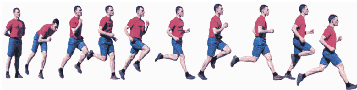
Рис. 12. Бег на 400 м

Создание помех другому военнослужащему, начало бега раньше команды "МАРШ!" (фальстарт) не допускаются.