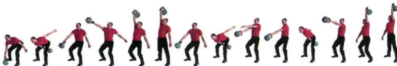
Рис. 5. Рывок гири