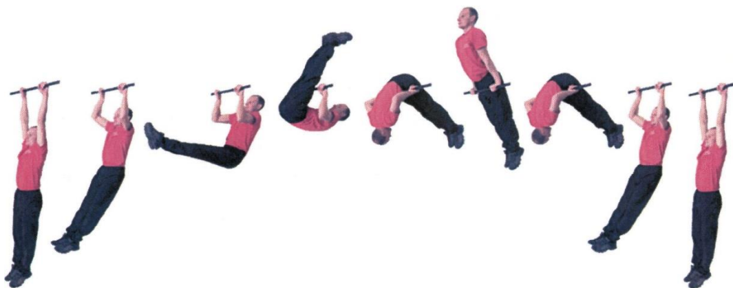
Рис. 3. Подъем переворотом на перекладине

При нарушении условий выполнения упражнения повторение не засчитывается, подается команда "НЕ СЧИТАТЬ".