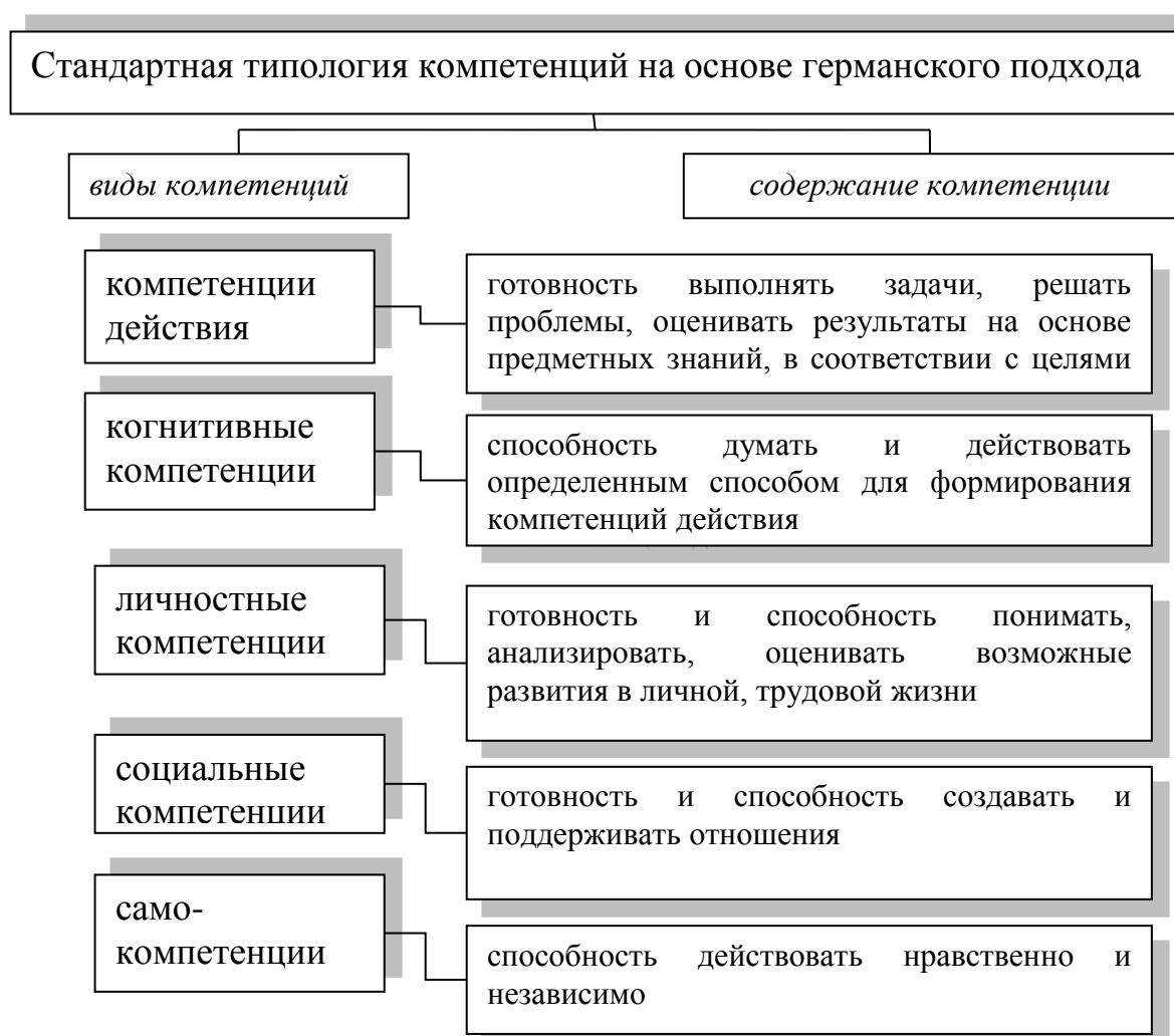
Рис. 4.2. Стандартная типология компетенций на основе германского подхода

Таким образом, современный этап развития содержания термина «компетенции» представляет собой анализ многомерных моделей, систем, объединяющих профессиональную сущность компетенции, базисные знания, личностные характеристики и их взаимодействие.