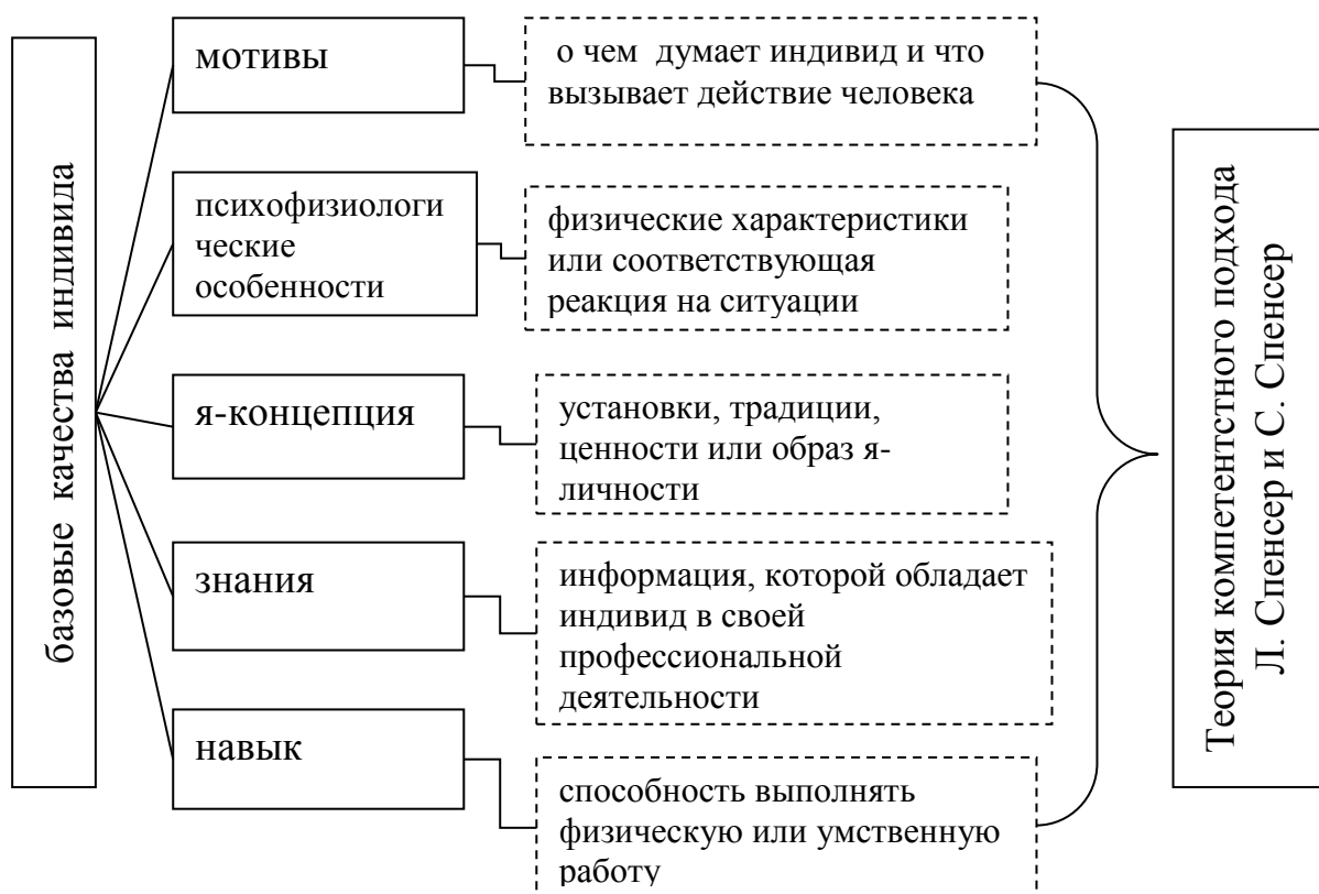
Рис. 4.1. Основополагающие качества индивида

Они выделили пять типов базовых качеств индивида, которые представлены на рисунке 4.1.