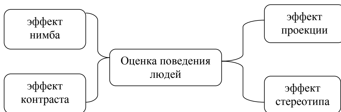
Рисунок 1.2. Основные типы оценки поведения людей

Поведение человека определяется или внутренними (свойства человека), или внешними причинами. Воспринимая поведение других, люди часто используют упрощения, представленные на рисунке 1.2 [28].