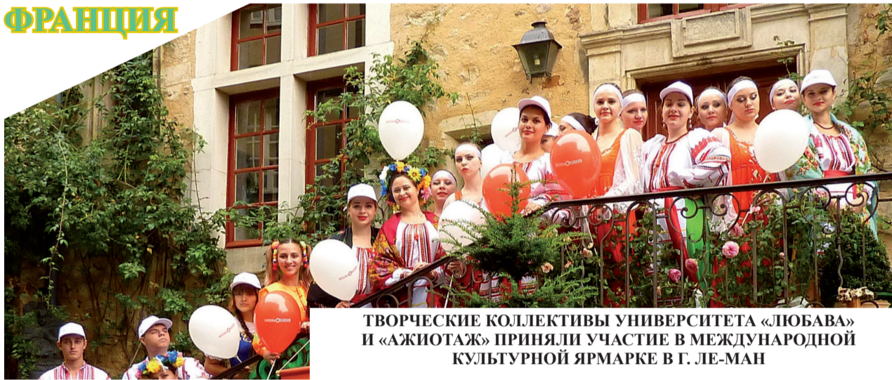
ТВОРЧЕСКИЕ КОЛЛЕКТИВЫ УНИВЕРСИТЕТА «ЛЮБАВА» И «АЖИОТАЖ» ПРИНЯЛИ УЧАСТИЕ В МЕЖДУНАРОДНОЙ КУЛЬТУРНОЙ ЯРМАРКЕ В Г. ЛЕ-МАН

незабываемые впечатления у жителей и гостей Ле-Мана. Во время ярмарки студенты РГУПС смогли выступить на нескольких площадках, и посетители ярмарки с большим интересом ждали встречи с нашими артистами и их творчеством. Каждое выступление сопровождалось бурными аплодисментами и пожеланиями встретиться вновь в следующем году.